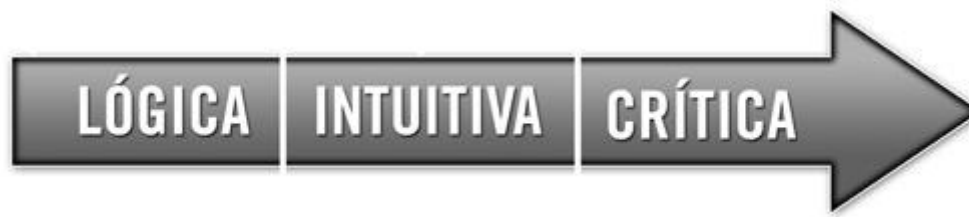
Imagen de creación propia. Autores J.Mendez y A.García.

Fase lógica: comprende la definición del problema, la recogida de datos y una primera aproximación a las posibles soluciones. Ésta se identificaría con la fase de Preparación establecida por Wallas.